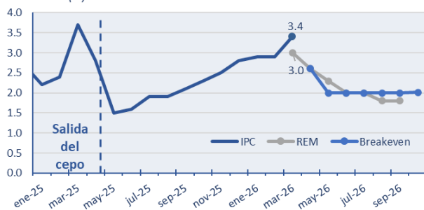
Figura 1. La inflación vuelve a sorprender al alza var. mensual (%)

La inflación de marzo volvió a ubicarse por encima de lo esperado, al registrar un aumento del 3,4% mensual, 0,5 pp por encima del dato de febrero y 0,4 pp más alto que lo espero por el REM (ver figura 1). De esta manera, se acumulan diez meses consecutivos sin desaceleración en la dinámica mensual de precios. En términos interanuales, la inflación se ubicó en 32,6%, mientras que el primer trimestre cerró con un incremento acumulado de 9,4%.