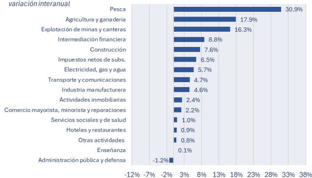
Figura 2. La recuperación de marzo fue generalizada variación interanual

A nivel sectorial, la recuperación fue generalizada y alcanzó a casi todos los sectores de actividad (Figura 2). El principal aporte al crecimiento provino de Agricultura y ganadería (+17,9%), que explicó 1,42 puntos porcentuales de la variación interanual del EMAE. También se destacaron la explotación de minas y canteras (+16,3%), la intermediación financiera (+8,8%), la construcción (+7,6%) y los impuestos netos de subsidios (+6,5%) (Figura 2).