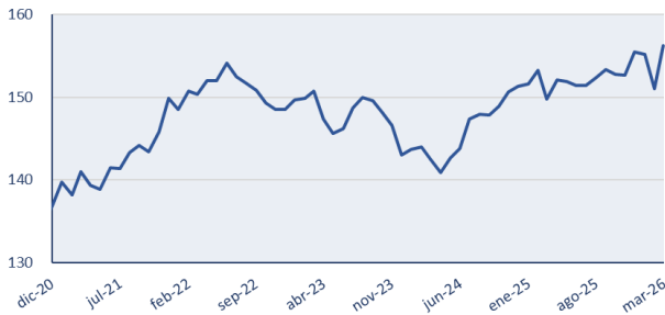
Figura 1. El índice se recupera y alcanza su nivel más alto (156,3) EMAE sin estacionalidad, 2004=100

El EMAE de marzo registró una expansión interanual de 5,5%, acompañada por un fuerte avance mensual desestacionalizado de 3,5%, que más que compensó la caída observada en febrero (-2,7%) y de enero (-0,2%) (Figura 1). A su vez, la serie tendencia-ciclo volvió a mostrar una mejora de 0,4%, consolidando una trayectoria positiva que ya acumula varios meses consecutivos de crecimiento. Con este desempeño, el nivel de actividad alcanzó un nuevo máximo histórico en términos desestacionalizados y permitió que el primer trimestre cierre con una expansión acumulada de 0,5% respecto del cierre de 2025.