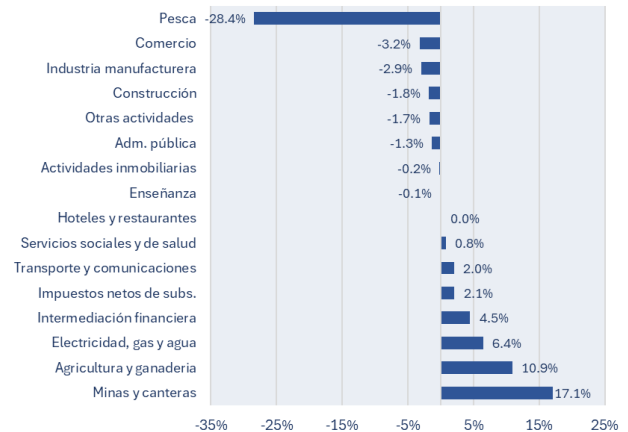
Figura 2. La recuperación de abril volvió a ser heterogénea variación interanual

En contraste, la recuperación continúa sin extenderse de manera uniforme al resto de la economía. La industria manufacturera (-2,9%), el comercio (-3,2%) y la construcción (-1,8%) volvieron a registrar caídas interanuales, mientras que otras actividades de servicios también permanecieron en terreno negativo. Este comportamiento refuerza la idea de una recuperación impulsada por sectores de alta productividad y vinculados a exportaciones, mientras que ramas más intensivas en empleo y orientadas al mercado interno todavía muestran dificultades para consolidar una mejora sostenida.